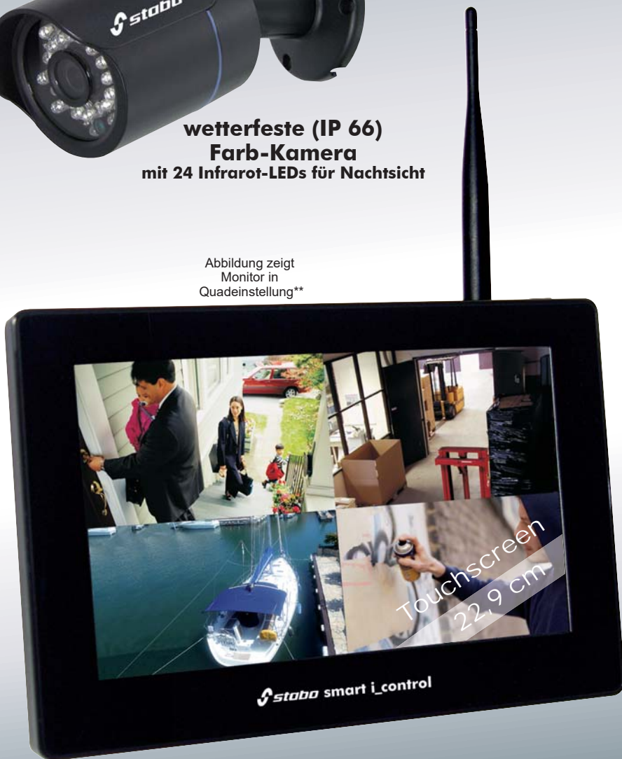
Abbildung zeigt Monitor in Quadeinstellung**

22,9 cm (9") LCD-Touchscreen (1024 x 600)